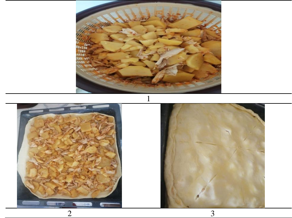
Resim 2. İç Malzemelerinin Karıřtırılması ve Hamurun Birleřtirilmesi (Fotođraf: Nisa Teber ve Sevgi Kıratlı)